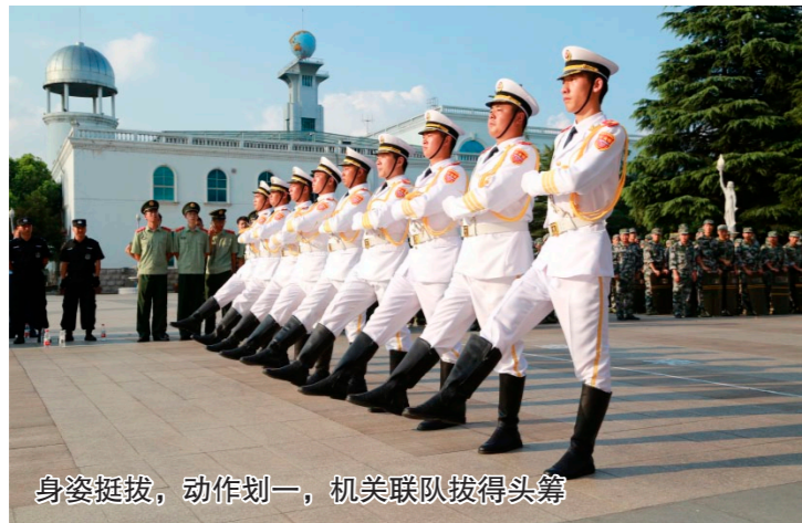
身姿挺拔，动作划一，机关联队拔得头筹