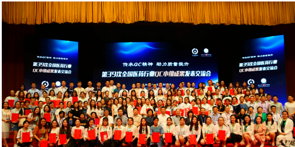
扬子江102个QC小组荣获第9届全国QC成果发表一等奖