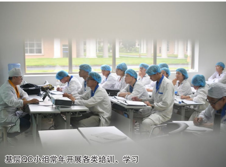
某QC小组常年开展各类培训、学习

“《研究梁芩清宁胶囊中微量重金属元素测定的新方法》课题，围绕企业为提升中药质量标准与国际接轨这一核心，对梁芩清宁胶囊中微量重金属检测方法进行研究，从而建立了一种新的检测方法。整个课题用图表、实验和数据说话，体现了小组成员的智慧和辛勤劳动。新的检测方法满足了企业的需要，对提升企业竞争力作用明显。”日前在四川成都举办的第39次全国医药行业QC小组成果发表总结会上，质量专家胡征对扬子江药业集团Discovery QC小组现场展示的这一创新型课题，给予了这样的评价，获得了阵阵掌声。