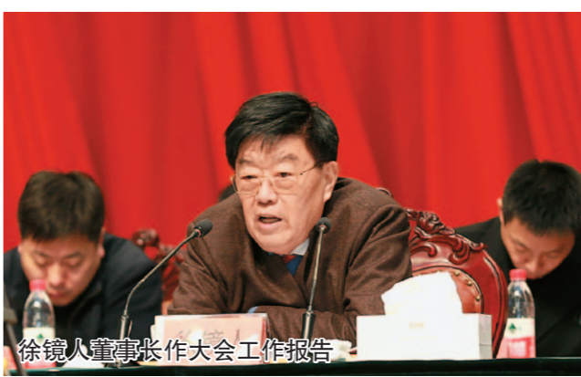
徐镜人部署集团工作

本报讯 12月31日，扬子江药业集团召开2018年工作会议，认真总结集团全年生产经营工作，表彰先进集体和先进工作者，精心部署2019年发展规划。集团党委书记、董事长徐镜人向大会作工作报告。泰州市委书记韩立明出席并作重要讲话。