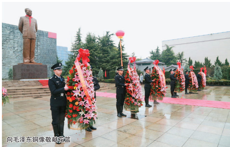
向毛泽东铜像敬献花篮

本报讯 2018年是伟大领袖毛泽东诞辰125周年，为了纪念毛泽东同志，继承和发扬伟人艰苦奋斗、全心全意为人民服务的崇高精神，将无限的怀念之情化作巨大的工作动力，2018年12月26日上午八时整，扬子江药业集团隆重举办了毛泽东铜像落成揭幕仪式。揭幕仪式由监察督察部部长龚卫同志主持，扬子江药业集团董事长徐镜人、集团党委书记、董事长徐镜人、集团党委委员、全体党员干部等300余人参加揭幕仪式。