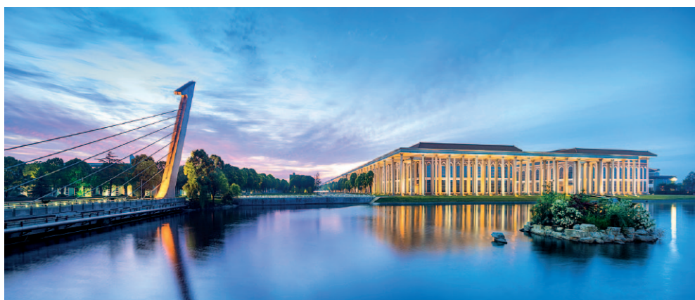
扬子江打造花园式厂区