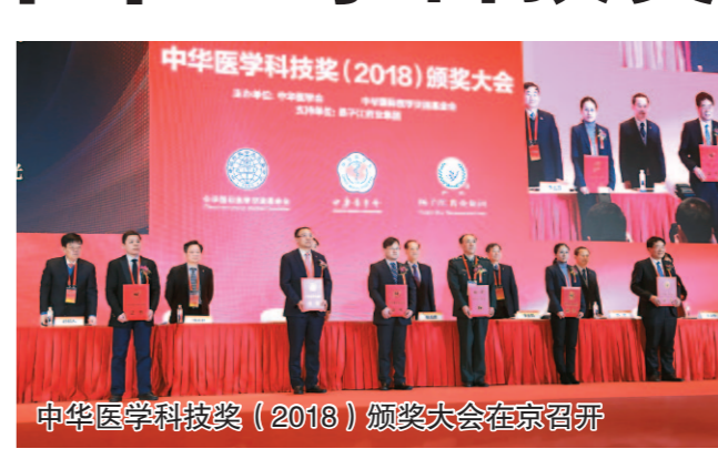
中华医学科技奖（2018）颁奖大会在京召开

中华医学科技奖是我国医药卫生行业最权威的奖项之一，自2001年设立以来，在扬子江药业集团协助下，共评选出国家级医学科研成果1460项。2018年，中华医学科技奖采用推荐方式，按照《中华医学科技奖奖励暂行办法》确立的“公平、公正、公开”评审原则，共评选出19项（人）获奖项目。中华医学会名誉会长韩启德院