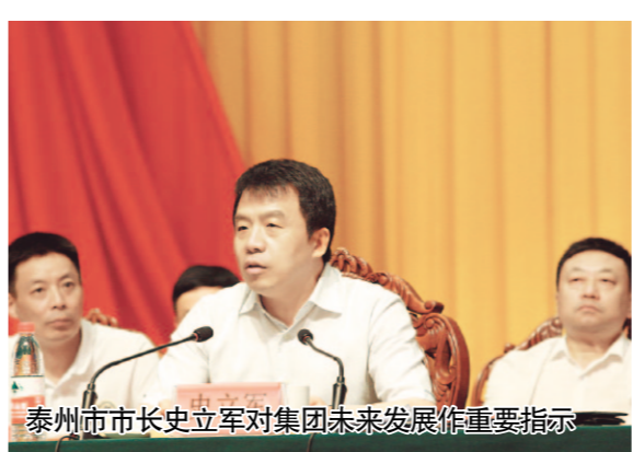
泰州市市长史立军对集团未来发展作重要指示