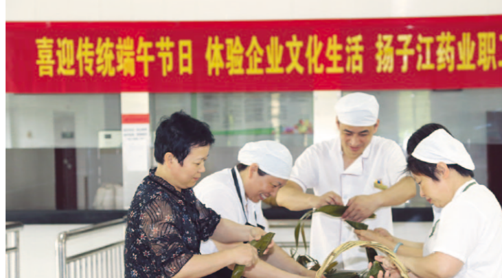
集团总部员工包粽子活动

为了传承历史文化，丰富员工文化生活，增强员工的企业归属感。集团后勤保障部组织开展了“情浓五月天，欢乐过端午”包粽子活动。