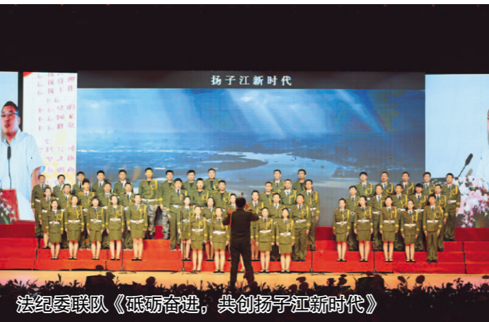
扬子江新声代合唱队《砥砺前行》

来自集团内外线各部门的16支合唱队，以高亢的歌声、雄壮的气势，呈现了一场精彩绝伦的演出。比赛中，大家把对党、祖国和企业的热爱，融入经典的乐章中，用整齐嘹亮的歌声抒发对党的无比热爱之情，充分展示拼搏进取、无私奉献、勇于创新的精神风貌。