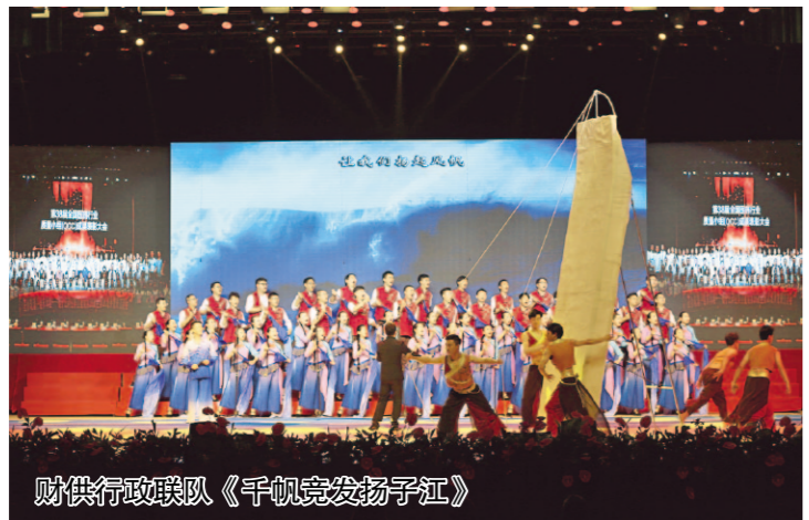
扬子江新声代合唱队《千秋功业扬于江》

本报讯 “没有共产党就没有新中国”、“唱支山歌给党听，我把党来比母亲”……6月28日，扬子江药业集团大礼堂歌声嘹亮，党旗飘扬，集团第19届“七一”大合唱比赛隆重举行。扬子江人用激昂的歌声歌颂党、颂党恩，庆祝中国共产党建党97周年。