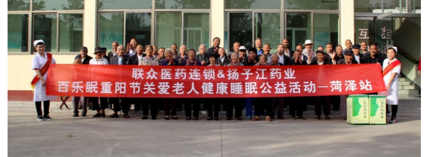
联众医药连锁和扬子江药业百乐眼重阳节关爱老人健康睡眠公益活动菏泽站

志愿者们陆续抵达沈阳市、保定市多家敬老院，为居住在那里的老人送上水果、牛奶等营养品和帽子、手套等生活用品。每到一处，都贴心地为老人们打扫卫生、更换床单被褥，嘘寒问暖，和他们聊家常。此外，海意公司还与多家连锁药店一起，为老人们免费测量血压、血糖，同时开展健康知识讲座，呼吁老人和养老院的工人员重视老年人的睡眠质量，保障身体健康和心情愉悦。海意公司表示，将持续举办类似公益活动，回馈社会。（海意公司 朱 艳）