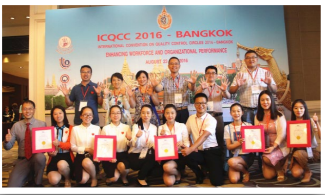
勇夺5枚国际QC金奖金牌。