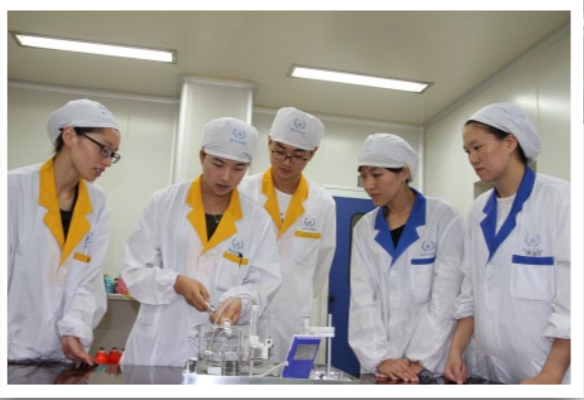
QC小组成员正在进行实验。