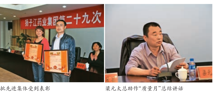
“质量月”活动总结大会现场