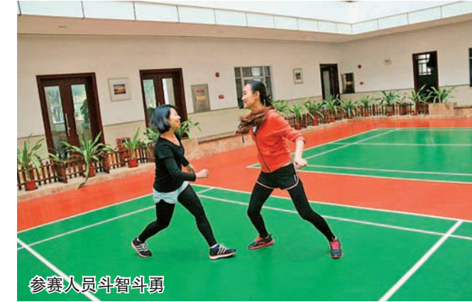
合泰人员参与健身课

在职工之家415室，新进员工及车间党员即兴表演了合唱、跳舞等才艺，使现场气氛更加热烈。交流期间新员工们也无所顾虑，大胆地说出了自己的想法，把自己的情况及未来的规划和车间主任交流，并向主任倾诉了自己工作生活方面的困惑之处。一起来找到最关切的问题的解决方