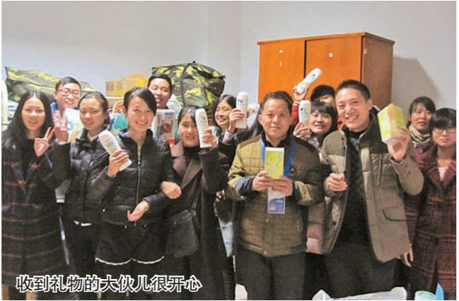
聆听领袖的谆谆教诲