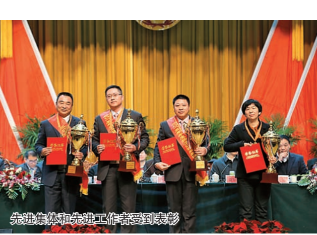
高港区委书记王建为扬子江药业集团颁奖

量发展机遇，就集团推广先进质量管理技术和方法，加快提升产品质量，完善质量监管体系，夯实质量管理发展基础，推进品牌建设等方面建言献策。集团总公司及子公司质量负责人在发言中纷纷发言，切实加强质量管理的舞台，通过交流探讨“十三五”品牌文化、夯实品牌基础，增强质量信誉和品牌价值，提升质量品牌附加值，打造一流的质量品牌，为扬子江市场营销提供高质量、高附加值，高