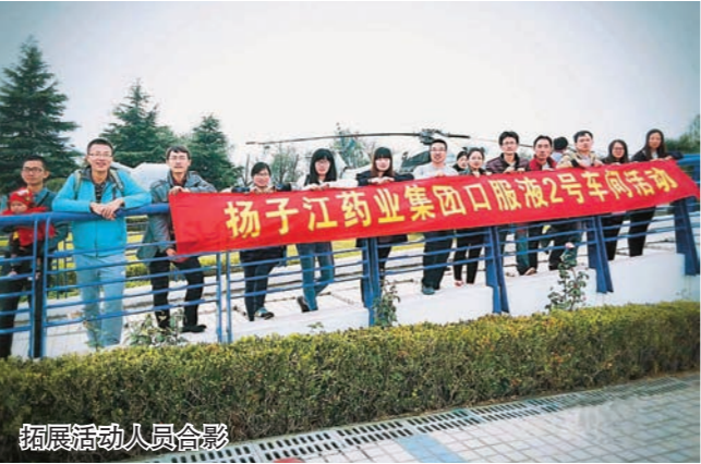
拓展活动人员合影